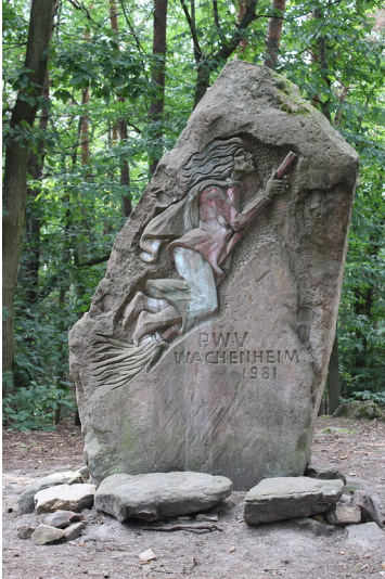
Ritterstein Nr. 268 "PWV Wachenheim 1981 (Hexenstein)" westlich von Wachenheim (2021)