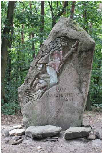
Ritterstein Nr. 268 "PWV Wachenheim 1981 (Hexenstein)" westlich von Wachenheim (2021)