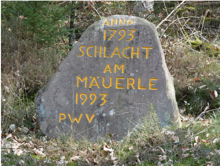
Ritterstein Nr. 302 „Anno 1793 Schlacht am Mäuerle 1993“ nördlich von Nothweiler (2022)