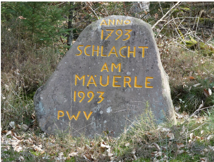
Ritterstein Nr. 302 „Anno 1793 Schlacht am Mäuerle 1993“ nördlich von Nothweiler (2022)