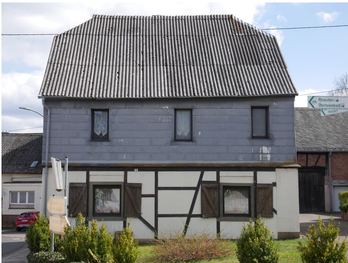
Das Fachwerkhaus Hauptstraße 3 in Hottenbach, genannt Haus Wolfe bzw. Haus Kolletzki (2021)