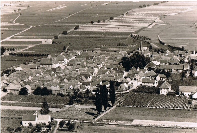
Luftbild der Ortsgemeinde Kirrweiler (Pfalz) (1966)