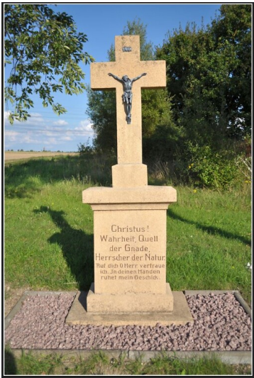
Wegkreuz bei Roth am nördlichen Ortsrand