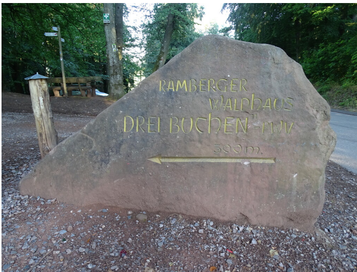
Ritterstein Nr. 234 Ramberger Waldhaus Drei Buchen 300 m nordöstlich von Ramberg an der L 506 (2020)