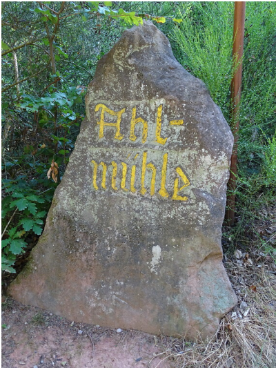
Ritterstein Nr. 222 „Ahlmühle“ östlich von Bindersbach (2020)

Schlagwörter: Ritterstein Fachsicht(en): Landeskunde Gemeinde(n): Leinsweiler Kreis(e): Südliche Weinstraße Bundesland: Rheinland-Pfalz