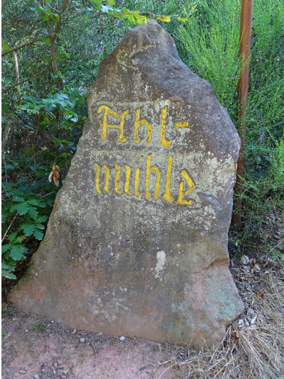
Ritterstein Nr. 222 „Ahlmühle“ östlich von Bindersbach (2020)

Schlagwörter: Ritterstein Fachsicht(en): Landeskunde Gemeinde(n): Leinsweiler Kreis(e): Südliche Weinstraße Bundesland: Rheinland-Pfalz