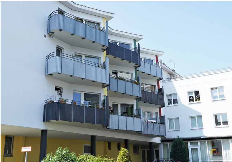
Appartmentkomplex Uhlandstraße 23 in Lindenthal (2022)