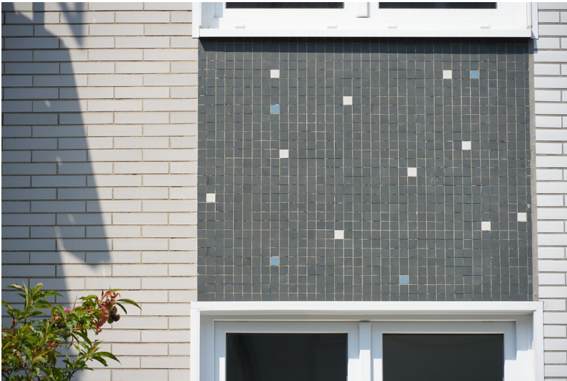
Kacheln an der Fassade des Wohnhauses in der Uhlandstraße 11 in Lindenthal (2022)