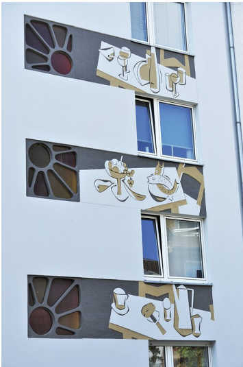
Sgraffiti an der Fassade der Klosterstraße 14 in Lindenthal (2022)