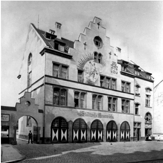
Historische Aufnahme der Alten Feuerwache Bonn in der damaligen Maxstraße im Jahr ihrer Fertigstellung und des Bezugs 1905.