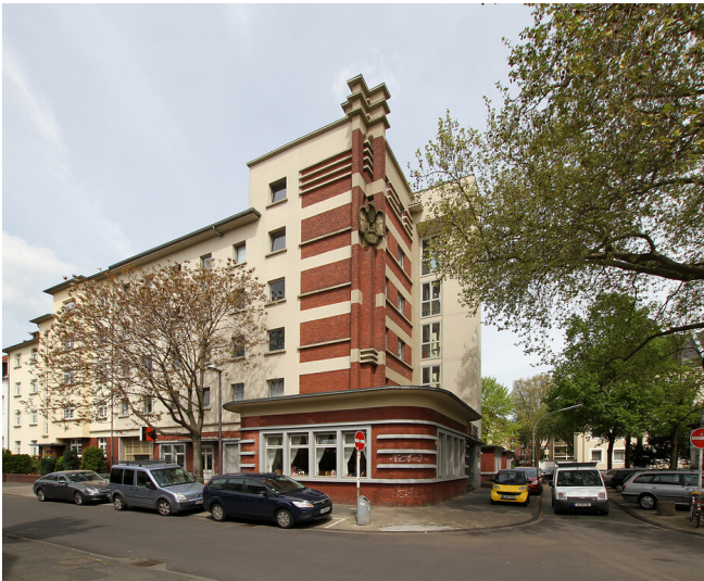
Kolpinghaus in Köln-Mülheim (2012)