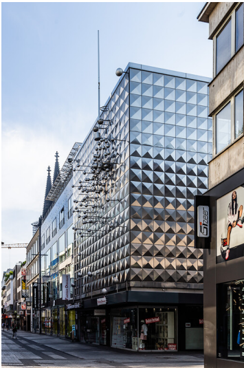
Fassade des ehemaligen Wormland-Hauses in der Hohe Straße in Köln Altstadt-Nord (2020)