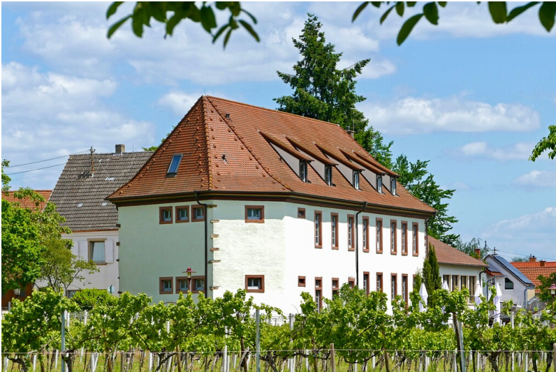
Der Edelhof in Kirrweiler, Ansicht aus ehemaligem Schlossbereich des Wasserschlosses Marienburg (2021)