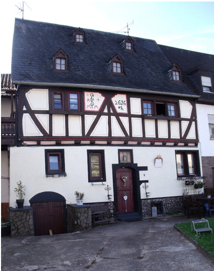
Marienstatter Hof in Koblenz-Lay