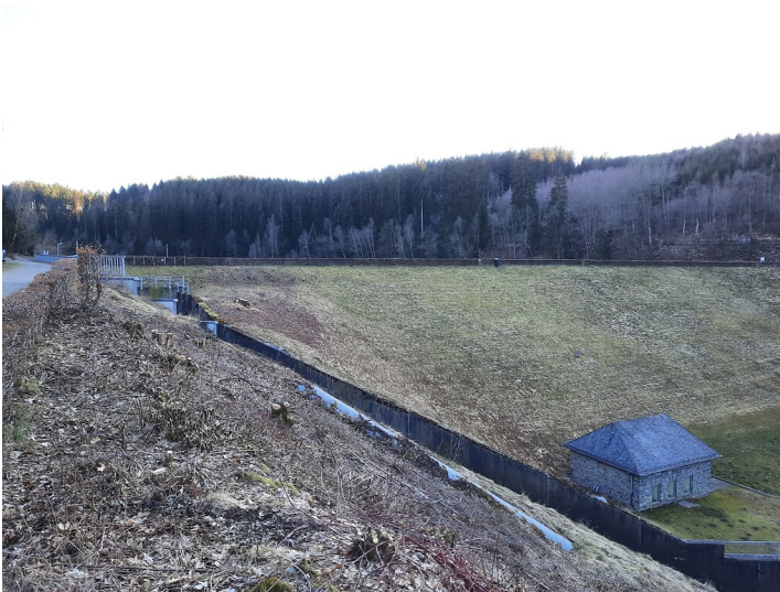
Staudamm der Perlenbachtalsperre (2022)