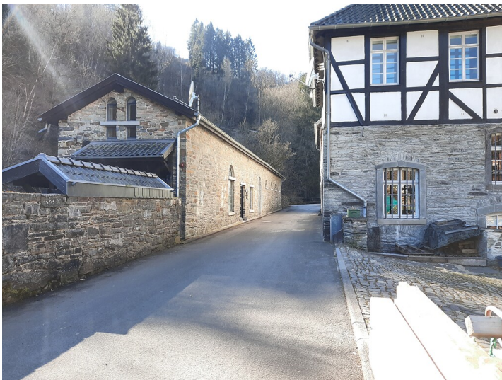
Bruchsteinhaus und Industriegebäude der ehemaligen Tuchfabrik Scheibler (2022)