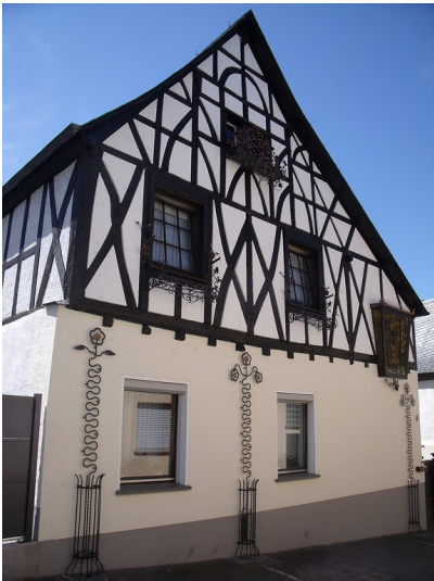
Fachwerkhaus in der Kaufunger Straße 8 in Koblenz-Lay