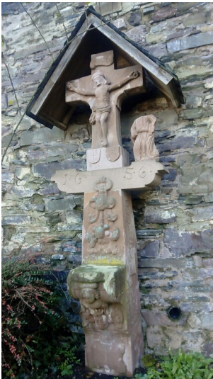
Wegekreuz von 1656 an der "Alten Kirche" von Sankt Aldegund