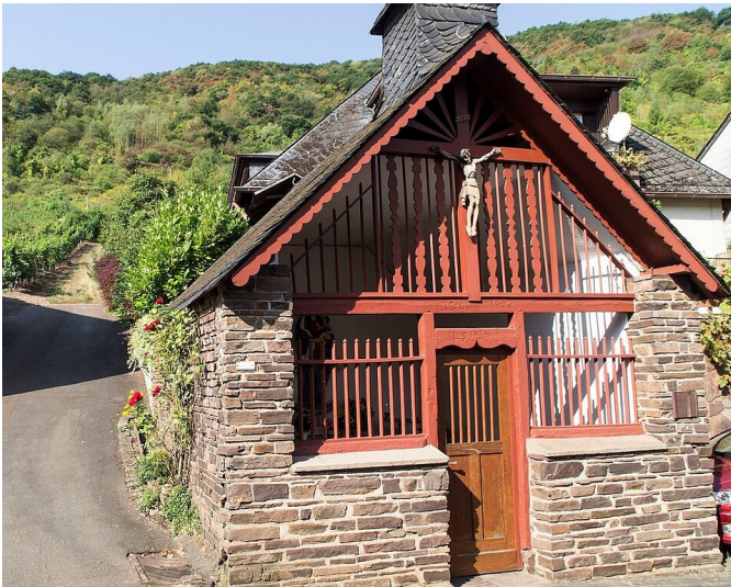
Heiligenhäuschen im Bungert in Sankt Aldegund