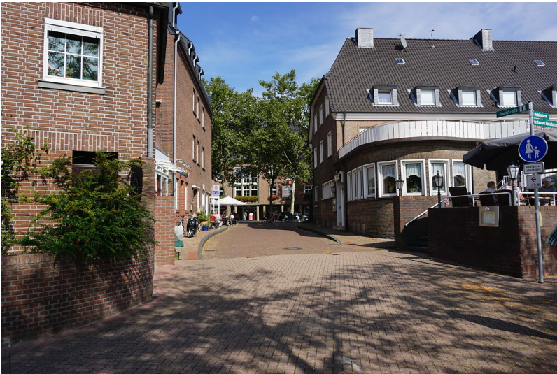
Rees, Rheinpromenade (2021). Wasserstraße, im Hintergrund der Marktplatz mit Rathaus. In Höhe des gerundeten Vorbaus lag das Krantor