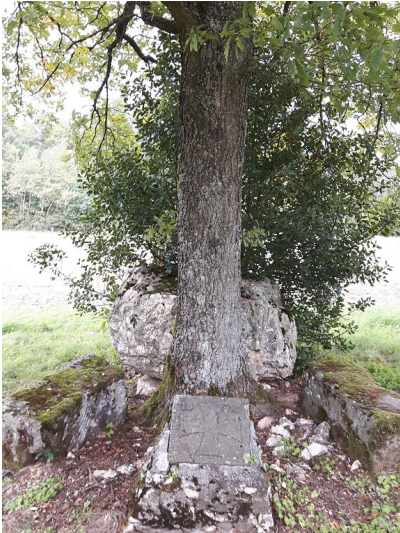
Eiche und Reste eines Denkmals (2017)