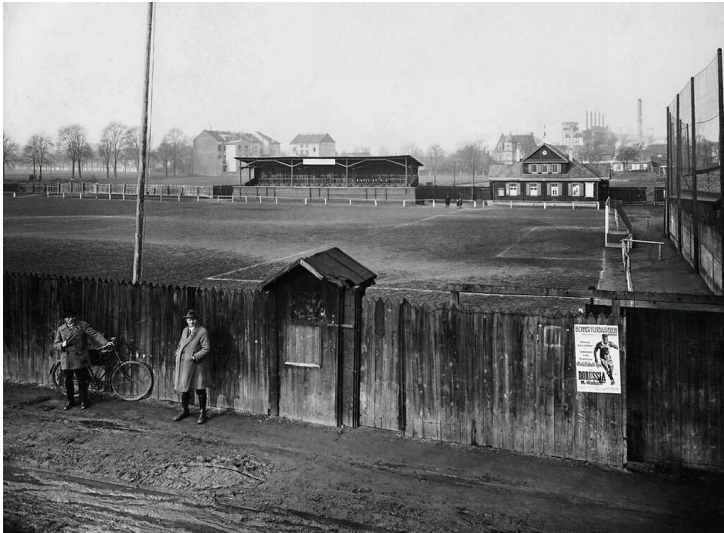
Historische Aufnahme des Sportplatzes in der Bonner Richard-Wagner-Straße aus dem Jahr 1927. Auf einem Plakat am den Platz umgebenden Holzzaun wird ein Spiel gegen "Borussia M.-Gladbach" angekündigt.