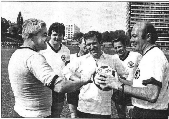
Bundespolitiker im Trikot: Horst Ehmke (links) und Manfred Wörner spielten gerne selbst im Gronaustadion.

Undatierter Zeitungsausschnitt (um 1980) mit einer Aufnahme von Spielern des FC Bundestag im Sportpark Gronau in Bonn.