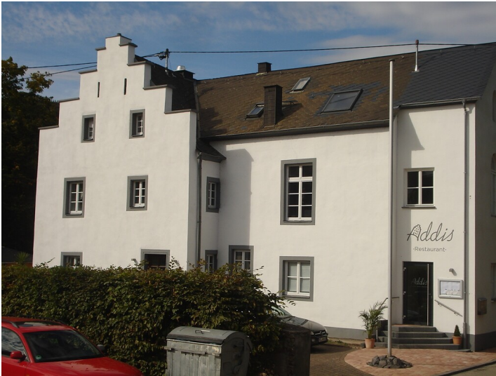
Haus Am Kirmesplatz 11 in Koblenz-Lay