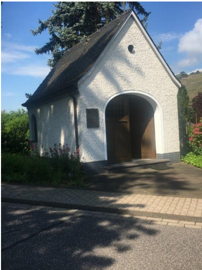
Obermarkkapelle in Koblenz-Lay