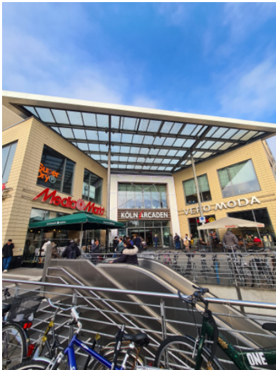
Eingangsbereich der Köln Arcaden in Köln-Kalk (2021)