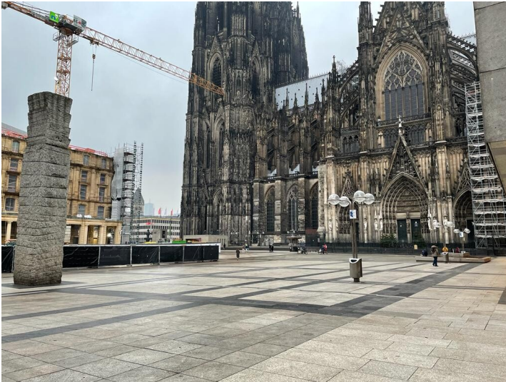
Der Roncalliplatz mit Blick auf den Kölner Dom, links im Bild die 1984 errichtete Himmelssäule (2021).