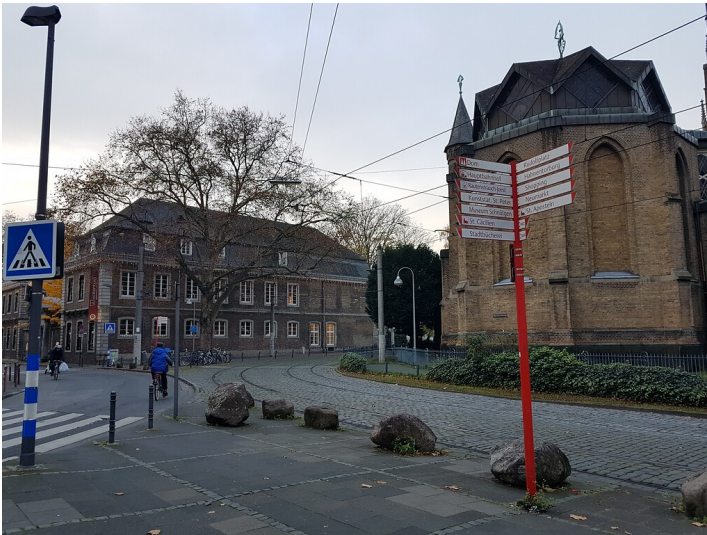
Der Mauritiuskirchplatz in Köln Altstadt-Süd (2021)