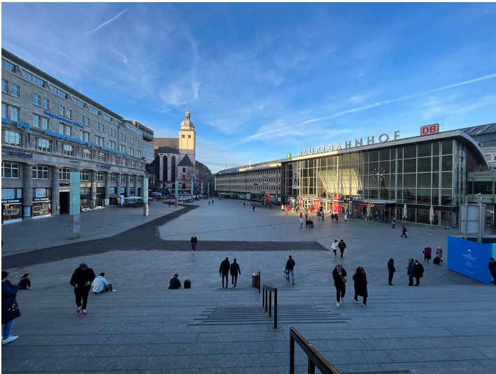
Blick von der Freitreppe des Kölner Doms in Richtung Bahnhofsvorplatz in Altstadt-Nord (2022)