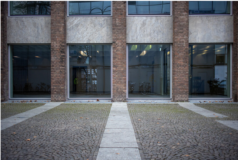
Platz "An der Rechtschule" in Köln Altstadt-Nord (2022)