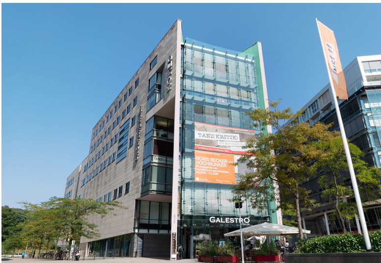
Gebäudeansicht der SK Stiftung Kultur im Kölner Mediapark (2019)