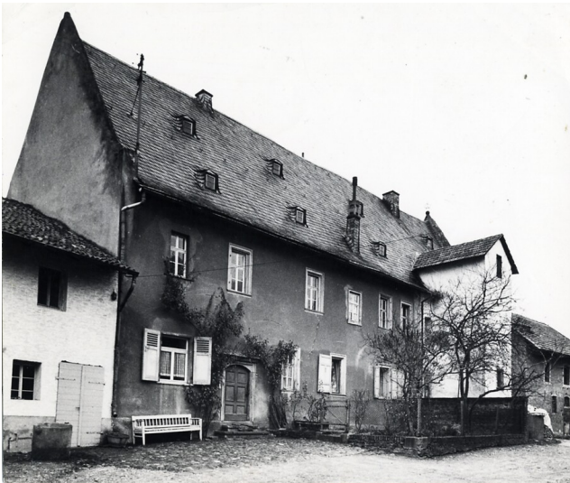
Historische Fotografie des ehemaligen Amtshauses, Haus im Schlosshof 1 in Waldlaubersheim (1934)