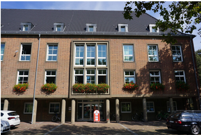
Rees, Rathaus am Marktplatz (2021). Altbau von 1955