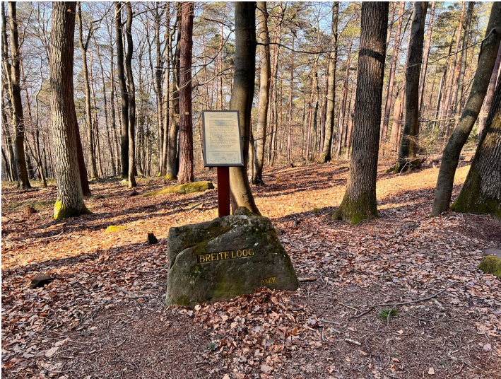
Ritterstein Nr. 255 "Breite Loog" südwestlich von Lambrecht (2022)