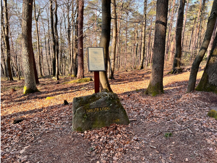
Ritterstein Nr. 255 "Breite Loog" südwestlich von Lambrecht (2022)