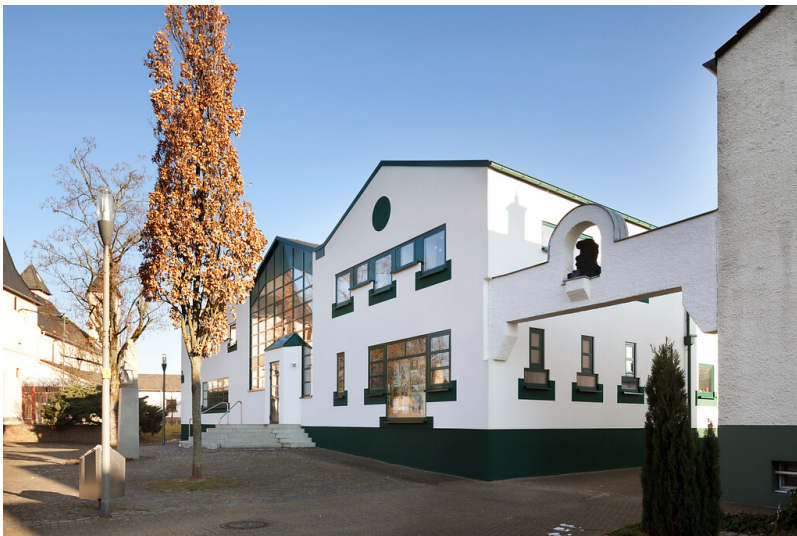
Köln-Merkenich, Siedlung Rheinkassel: Blick von Südwesten in die Amandusstraße (2017).