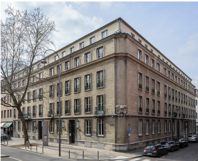
Außenansicht des EL-DE-Hauses am Appellhofplatz / Ecke Elisenstraße in Köln (2016)