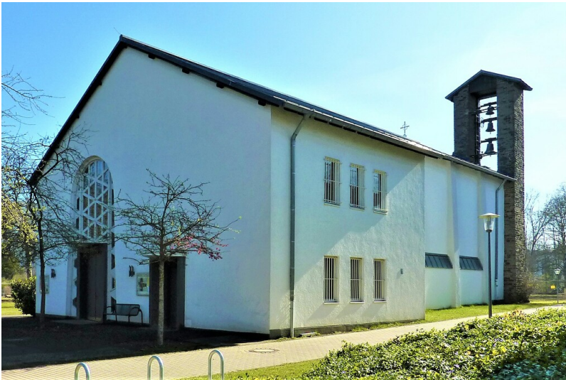
Die St. Anna Kapelle in den Köln-Riehler Heimstätten, Ansicht von Nordwesten (2014).