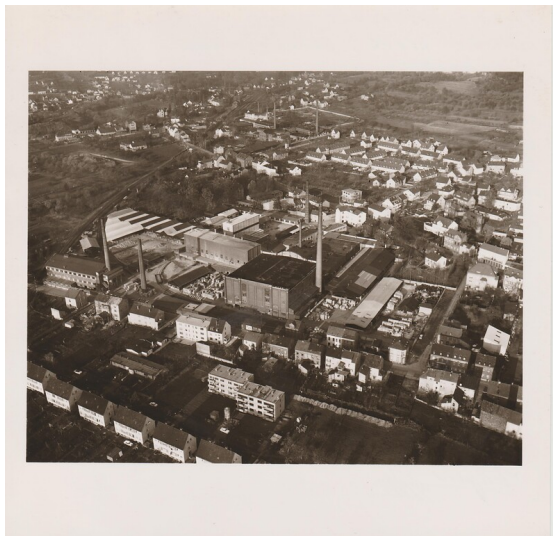
Luftaufnahme der "Rheinische Schamotte- und Dinas Werke" in Bendorf (1927)