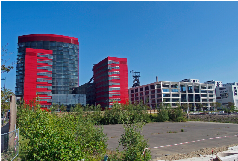
Wissenschaftsstadt Belval (2023)