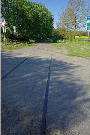
Ehemalige Bahnstrecke Bastnach (Bastogne) – Martelingen (Martelange) (2023)