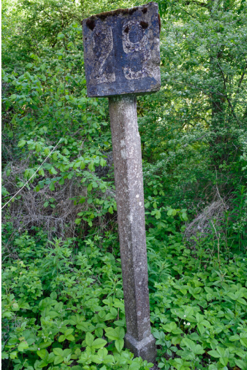
Bahnstrecke Geilich (Gouvy) Bastnach (Bastogne) (2023)