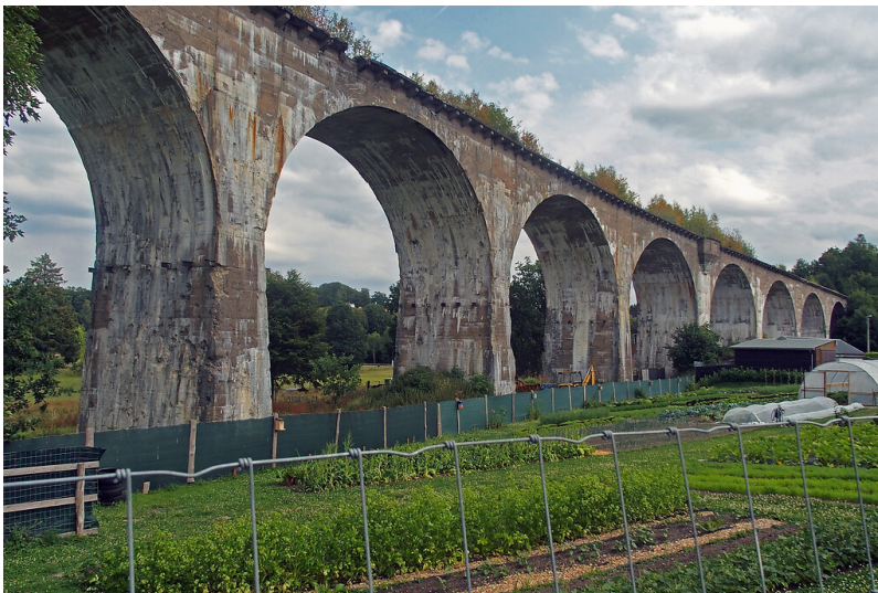
Viadukt von Born (2022)