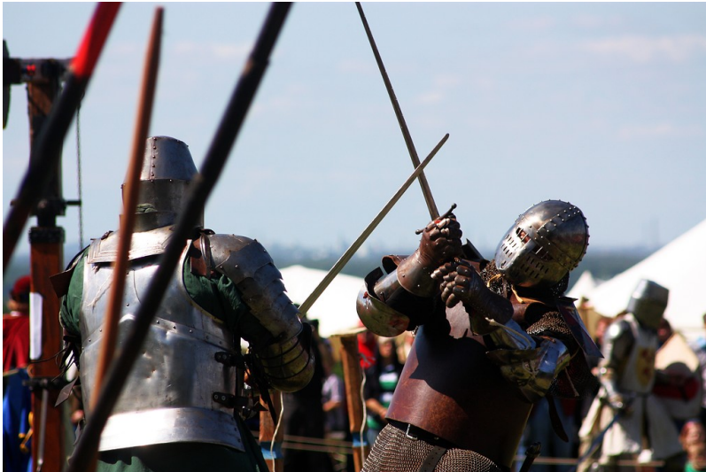
Erinnerung an die Schlacht bei Worringen im Jahr 1288 im Rahmen von Ritterspielen bei einem Historienspektakel in Düsseldorf (2013).