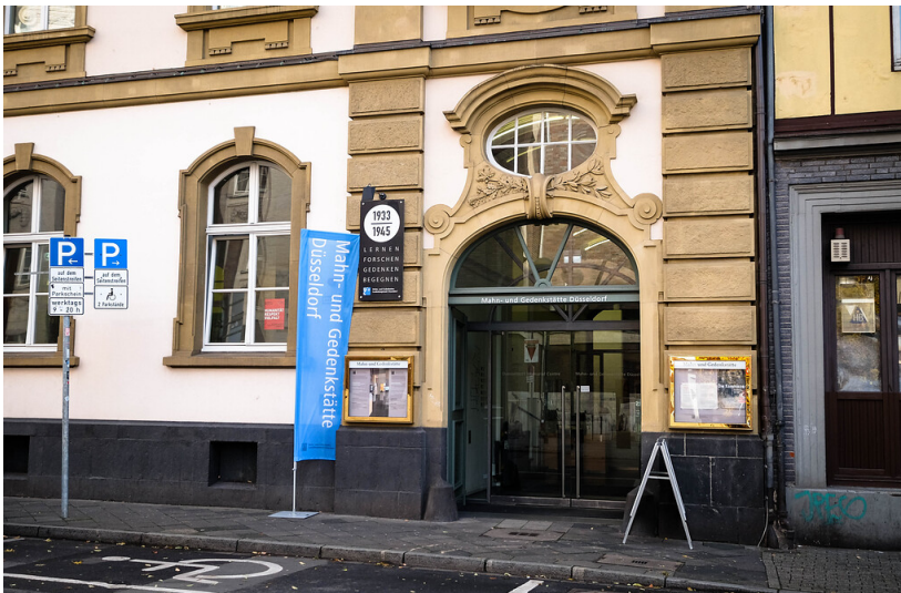
Eingangsbereich der Mahn- und Gedenkstätte Düsseldorf (2021)