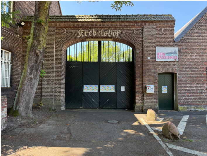
Eingangportal des Kriebelshof in Köln-Worringen (2025)