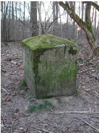
Der Myriameterstein 51 (bzw. LI in römischen Ziffern), linksrheinisch bei Flusskilometer 679,49 in Köln-Weiß (2012), Ansicht der Wasserseite.